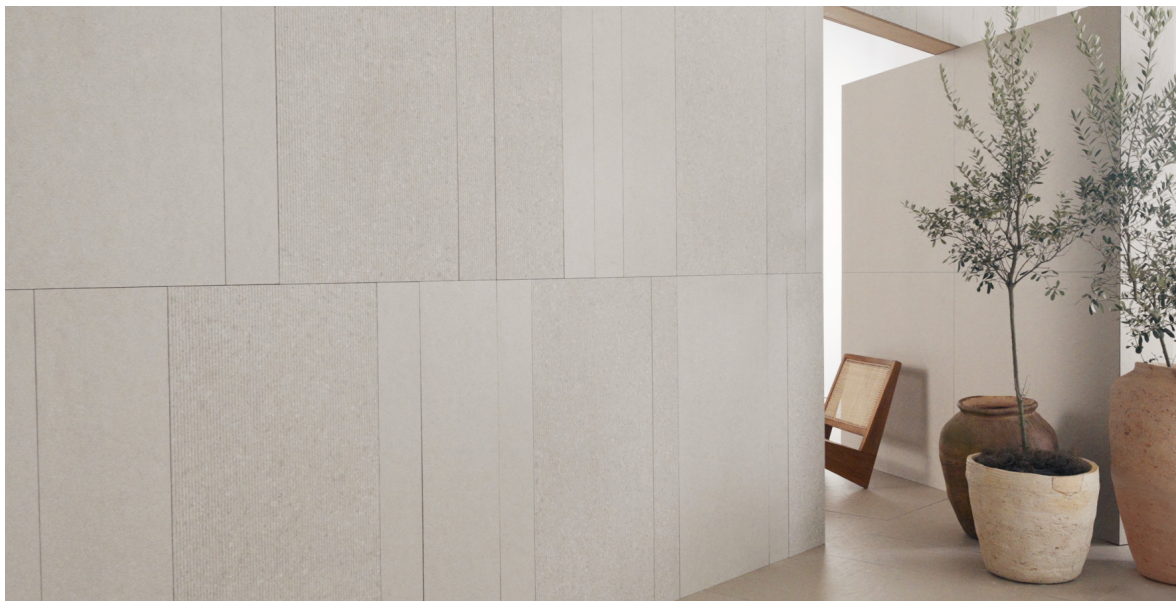
FGMF Sílica Gris MA 60x120cm, 30x120cm, 14,8x120cm e FGMF Risca Gris EXT 60x120cm, 30x120cm, 14,8x120cm . Foto: Onze Trinta Studio Criativo . Produção: Debbie Apsan

“Gostamos de buscar soluções inesperadas para nossos os projetos. No caso dos revestimentos, pensamos em trazer essa possibilidade de dar poder para as pessoas decidirem como o espaço vai ficar. As pessoas podem utilizar de uma maneira muito livre, como gostaríamos de ter essa liberdade”, finaliza Lourenço Gimenis.