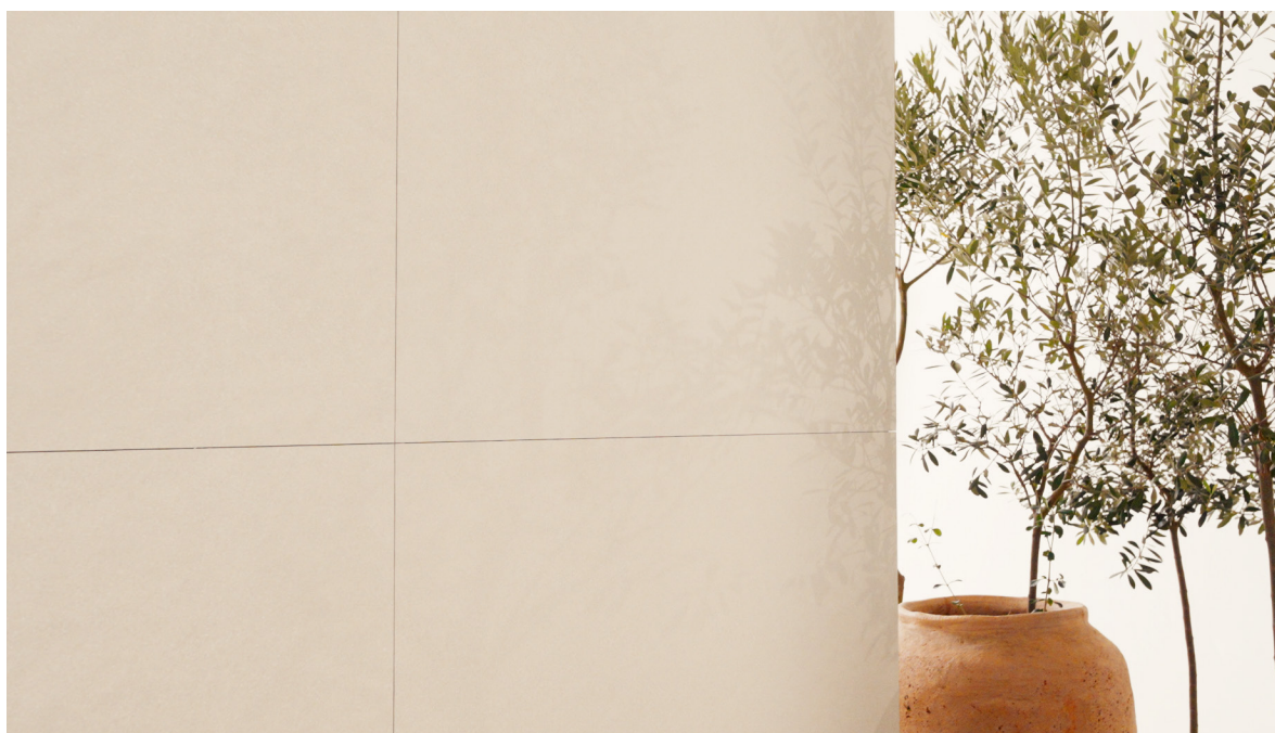
FGMF Sílica Corda MA 120x120

Nós buscamos inspirações diversas em que pudéssemos ter formatos diferentes, padrões diferentes. A mistura de peças lisas com peças rugosas ou riscadas trazem um efeito de movimento onde luz e sombra ganham novas tonalidades e formas”, pontua o arquiteto Rodrigo Ferraz.